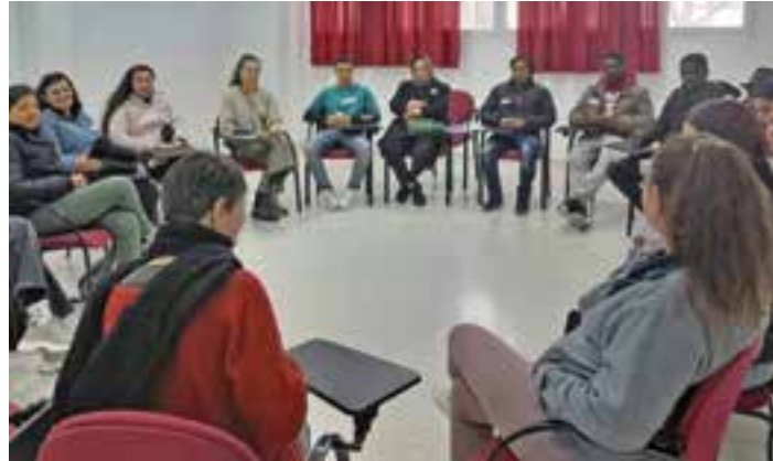
Taller de acompañamiento para personas migrantes de Cáritas Diocesana de Mérida-Badajoz.

La diócesis cuenta con 122 centros sociales y asistenciales que, el año pasado, atendieron a 14.871 personas. Entre ellas encontramos personas mayores, enfermos crónicos y con otras capaci-