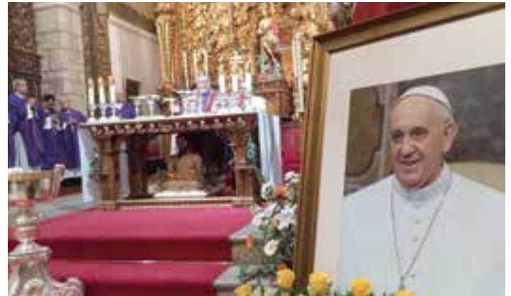
Una foto del papa Francisco ocupó un lugar destacado en la Catedral durante el funeral.

El arzobispo de Mérida-Badajoz, Monseñor José Rodríguez Carballo, presidió el pasado día 2 de mayo en la Catedral, la misa funeral por el eterno descanso del papa Francisco. El templo se llenó de fieles y sacerdotes, más de un centenar, que concelebraron la eucaristía. También asistieron numerosas autoridades civiles y militares.