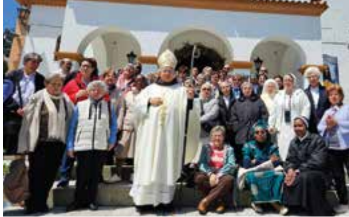
Cosnagradas participantes en esta jornada, junto al Arzobispo.